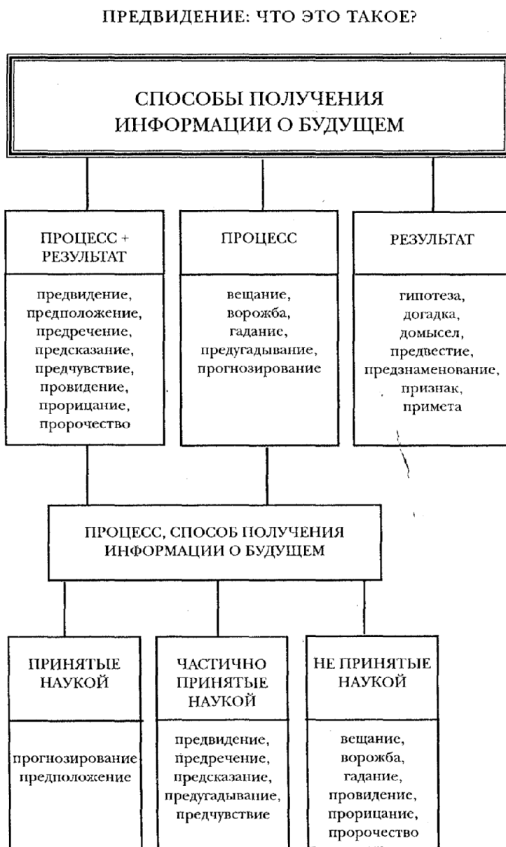
Схема 1. Способы предвидения будущего

Таков лишь один из множества способов получения информации о будущем из будущего. Каковы они – эти способы предвидения будущего , какими словами они обозначаются? (см. схему 1)