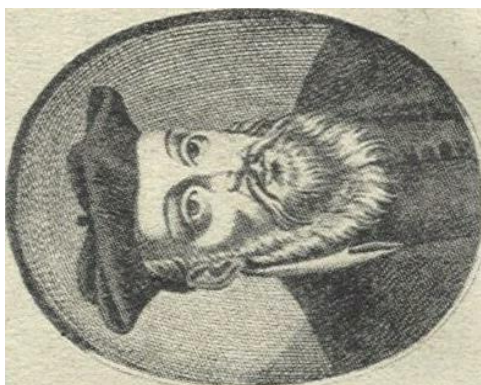
Рис.2 Нострадамус (По С. Гордон. Энциклопедия паранормальных явлений. М., 1999. С.299)

Другие же пророки, учитывая такой печальный опыт, старались свои послания сообщать таким образом, чтобы только люди будущего или с высоким интеллектом могли понять, что же сообщает им этот пророк. Самый яркий пример подобного – книга предсказаний Нострадамуса (см. рис. №2) «Центурии», впервые опубликованная в 1555 году.